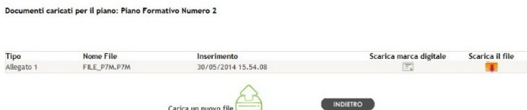
Fig. 4 –Lista File

Al termine del caricamento, se non è stata sollevata eccezione dal sistema, sarà aggiornata la lista dei file caricati, come mostrato in figura 4.